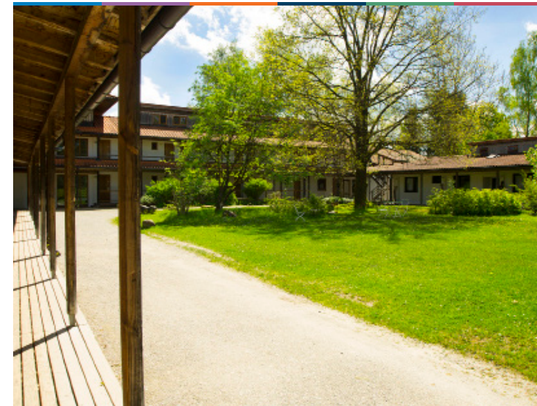
FORTBILDUNG – WORKSHOP