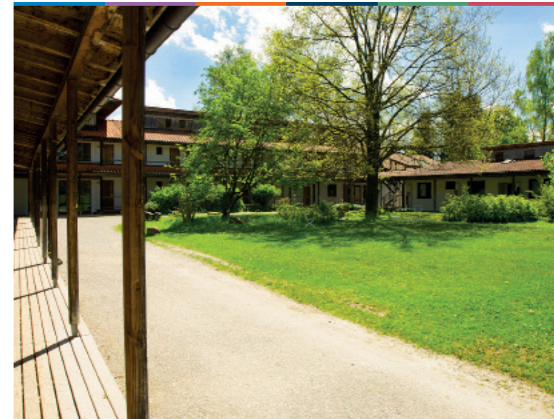
FORTBILDUNG – WORKSHOP